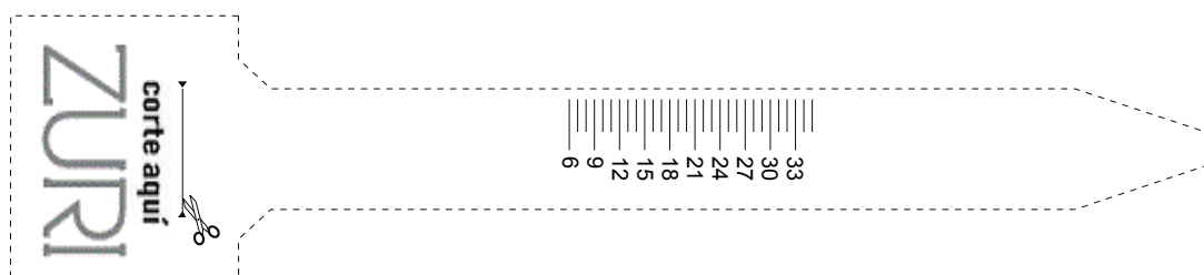
TABLA DE MEDIDAS